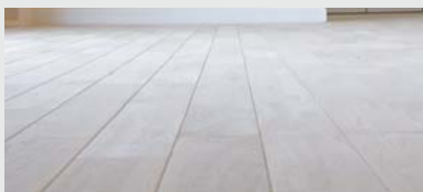
無垢材 - 床で心と身体に癒しを

無垢とは、混ざり気のないという意味で、1本の木から採れるつなぎ目のない材木のことで、年を重ねるほどに味わいや美しさが出てくるのが特徴で、断熱効果は突き板(合板)と比べても明らかで、足の裏から伝わる感触が温かくやさしいのです。また、気密性が高まっている現代の住宅だからこそ自然素材の床を使用すべきだと考えます。