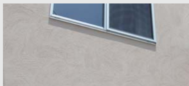
塗り壁 - 外壁sto塗り壁工法

この土地は、土地売買契約締結後3ヶ月以内にカメヤグローバル㈱と住宅の建築工事請負契約を締結していただくことを条件として販売するものです。この期間内に住宅の工事請負契約が成立しなかった場合には、土地売買契約はその効力を失い、受領済みの土地代金(但し、印紙代・振込手数料を除く)は全額無利息にて返還いたします。